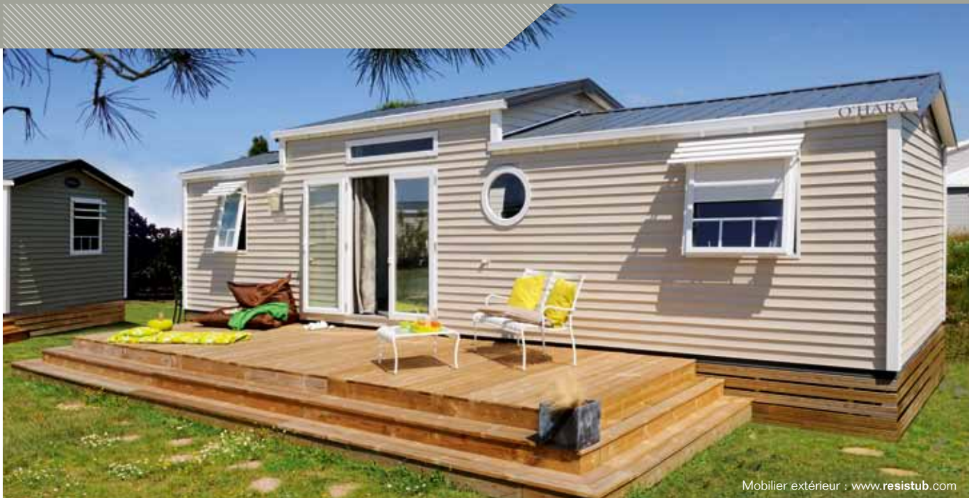
Mobilier extérieur : www.resistub.com